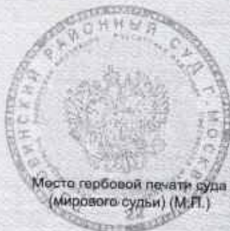
Место гербовой печати суда (мирового судьи) (М.П.)

Место работы: данные в материалах дела отсутствуют.